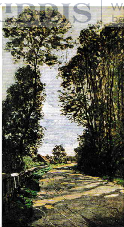
Drumul spre ferma lui Saint-Siméon lângă Honfleur, 1864

Ulei pe pânză, 81,6 × 46,4 cm The National Museum of Western Art, The Matsukata Collection