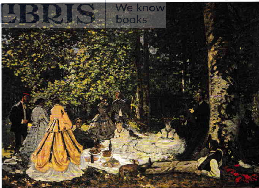
Dejun pe iarbă , 1866

Ulei pe pânză, 130 × 181 cm Moscova, Pushkin Museum